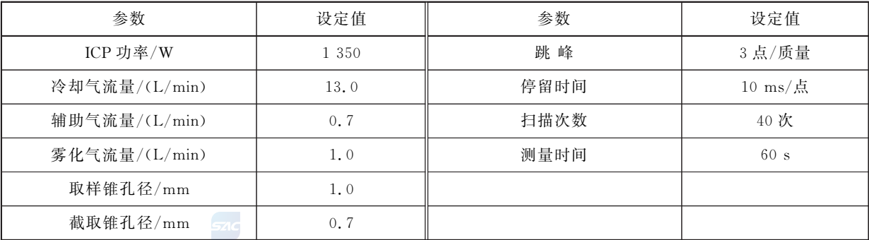
表 C.1 电感耦合等离子体质谱仪工作参考条件